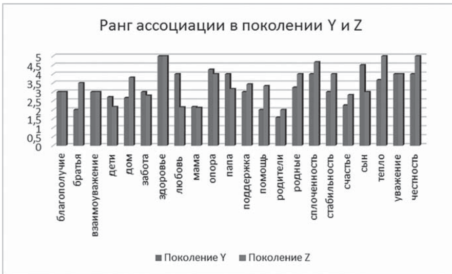
Рис. 2. Ранг ассоциаций в поколениях родителей (Y) и детей (Z)

имеют положительный характер. В ядро их социального представления входят понятия, которые формируют позитивный образ семьи, связанный с такими понятиями, как любовь, дом, родители, счастье. Таким образом, мы можем сделать вывод о схожести социальных