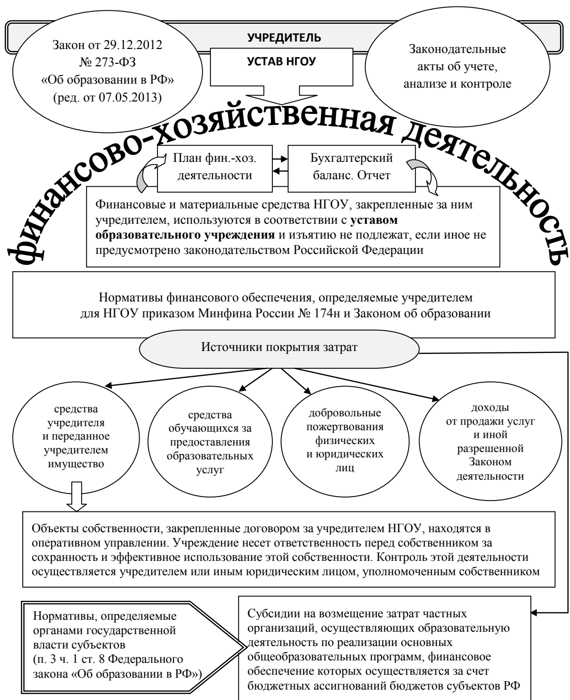
Рис. 3. Организационно-правовая основа формирования финансовой базы развития негосударственного образовательного учреждения (НГОУ)

Отсутствие в волеизъявлении по отношению к движению особо ценного имущества, закрепленного за учреждением собственником имущества (РФ, субъектом Федерации или муниципалитетом) отличительных признаков, затрудняет формирование уставов учреждений и, соответственно, выбор вариантов учетной по-