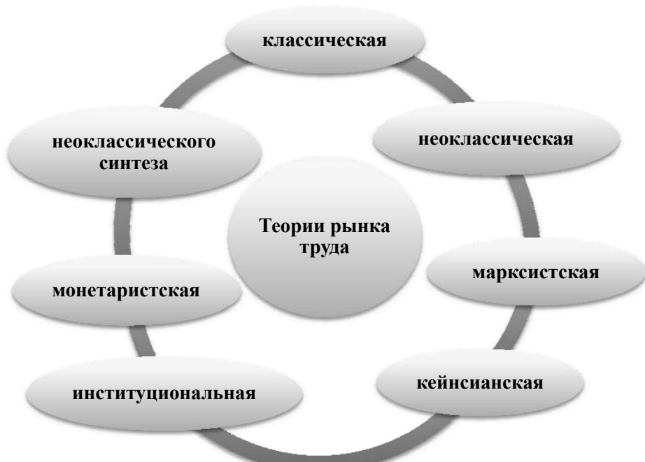
Рис. 1. Теории рынка труда (разработано авторами)

шательстве политики в экономическую жизнь, наличие саморегулирующейся системы на рынке труда между спросом и предложением с учетом личной заинтересованности человека.