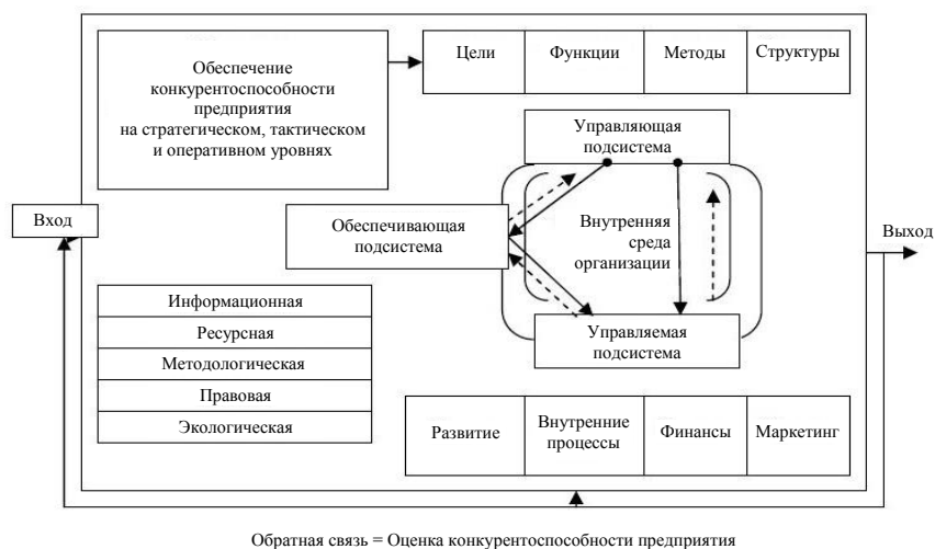
Рис. 2. Система управления качеством конкурентоспособной продукции [10]

Источниковедческий анализ свидетельствует о том, что систему управления качеством и конкурентоспособностью продукции можно представить в виде графической модели (рис. 2).