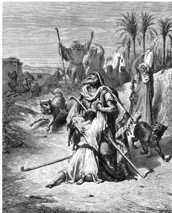
Рис. 4. “The Prodigal in the Arms of His Father” by Gustave Doré.

Luk 15:20–21 “And he arose, and came to his father. But when he was yet a great way off, his father saw him, ... And the son said unto him, Father, I have sinned against heaven, and in thy sight ...” Так деформируется реальность во времени, или так создаётся история.