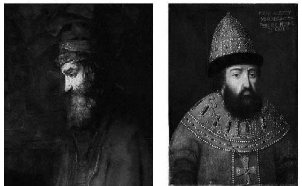
Рис. 3. Портрет «неизвестного» с картины Рембрандта и портрет царя Алексея Михайловича

Определенное сходство можно найти и между ликами молодого царя Алексея и «неизвестного» с картины Рембрандта.