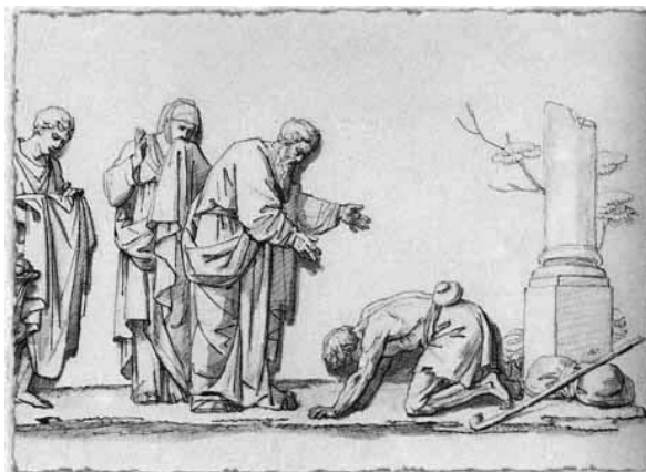
Рис. 5. 1810–1820 годы. В. Шебуев. «Возвращение блудного сына». 36 × 60,2. Русский музей