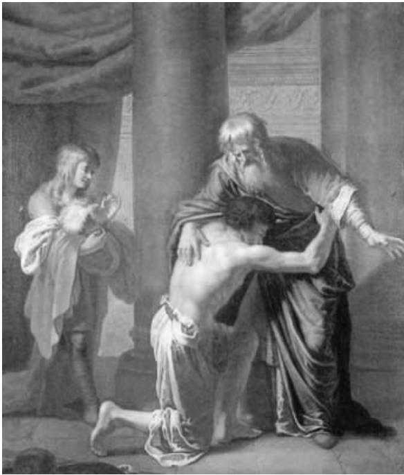
Рис. 5. И.П. Чернов. «Возвращение блудного сына». 1795 г.