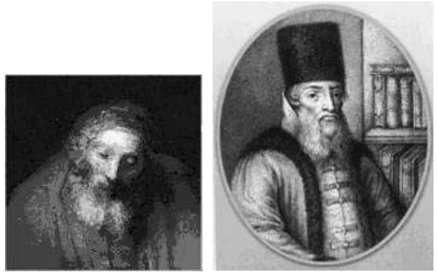
Рис. 2. «Отец» с картины Рембрандта и портрет Ордина-Нащокина

Отец наполовину закрыт сыном. Но лицо его, хорошо прописанное, довольно индивидуально, эти сильно впалые щеки, прямой крупный нос, пышная борода, как бы раздвоенная внизу. Все сильно напоминает облик Ордина-Нащокина на его знаменитом портрете.