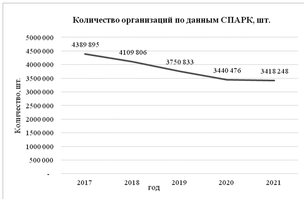
Рисунок 1. Количество российских организаций в динамике (2016–2021 годы)