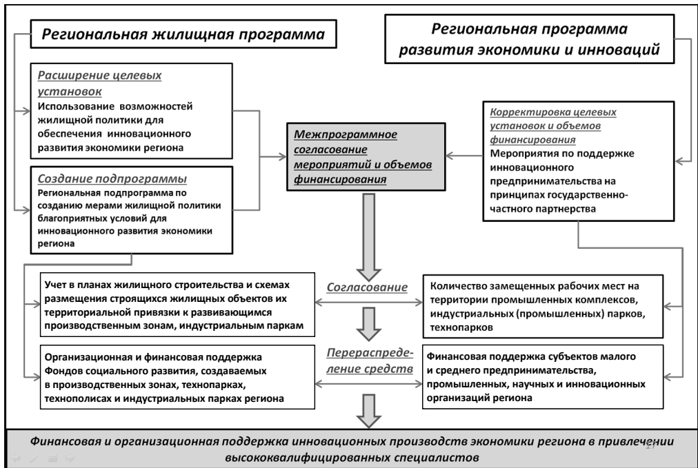
Рис. 2. Модель межпрограммных согласований для формирования и выполнения заданий жилищной и инновационной программ региона