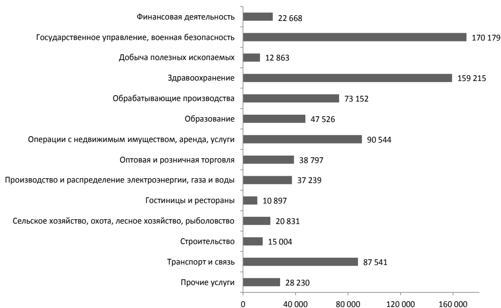
Рис. 1. Общая потребность в квалифицированных кадрах в России, человек [6]

Немаловажным остается вопрос потребности в квалифицированных кадрах в российской экономике – 814 686 человек (рис. 1).