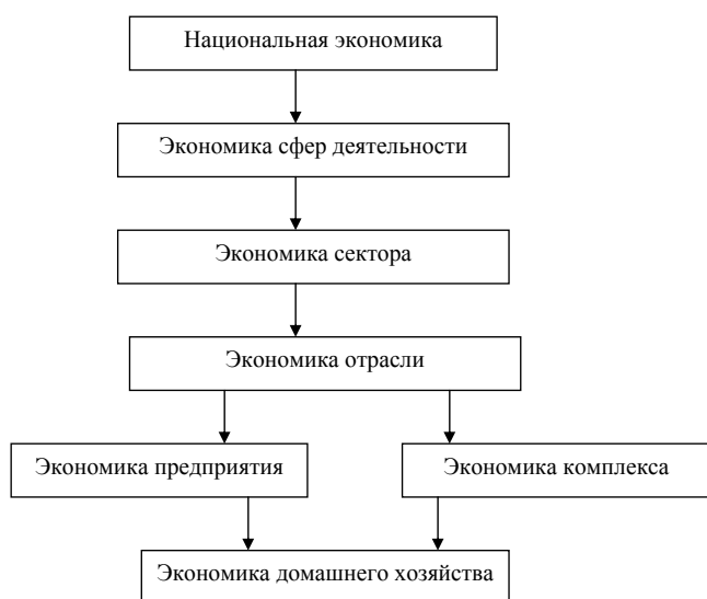
Рис. 1. Структура национальной экономики

производство, но и социальное, так как в домашнем хозяйстве рождается и на его материальной базе воспитывается будущий работник, то есть домашнее хозяйство обеспечивает производство и воспроизводство человеческого капитала.