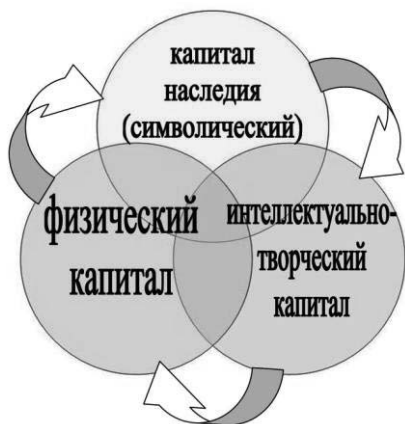
Рис. 8. Капитал комплексного объекта народных художественных промыслов

Символический капитал – это капитал культурно-исторического потенциала объекта НХП и его исторически сложившейся территории, формирующий потенциал бренда НХП. Нарращивание и закрепление символического капитала осуществляется преимущественно формой государственного финансирования – в деятель-