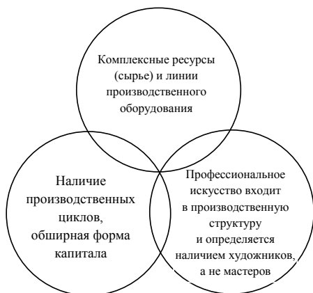
Рис. 3.3. Критерии структурно-функционального моделирования художественно-промышленных промыслов

Художественно-промышленный промысел – вид промысла, в котором доля производства изделий НХП составляет процентную долю продукции от общего производства и функционирует на рынке преимущественно как экономический объект с обширной формой капитала. Технология характеризуется множеством производственных циклов, а художественная стилистика включает в себя потенциал свободного творчества, так как профессиональное искусство входит в его производственную структуру (терминология автора) (рис. 3.3.).