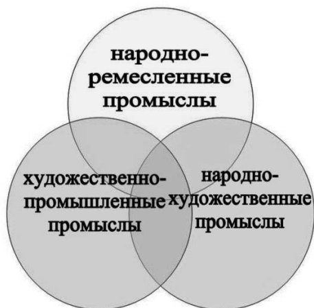
Рис. 3. Классификация видов промыслов

Типичное моделирование присутствует и в определении основных критериев оценки по каждому виду промыслов.