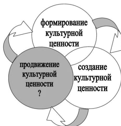
Рис. 11. Анализ эффективности финансового регулирования сферы НХП

На сегодняшний день актуальным становится системное преобразование сферы народных