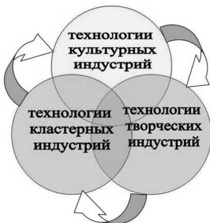
Рис. 7. Технологическая платформа деятельности объекта НХП

Технологии творческих индустрий. Именно технологии творческих индустрий формируют прибыль путем не линейного роста, а