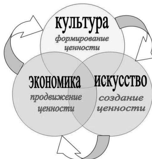
Рис. 1. Структурно-функциональное моделирование

Поэтому в ходе научных и практических исследований вопроса формирования научно-прикладной теории для сферы НХП автором была разработана универсальная модель, позволяющая формировать любые системные процессы в сфере НХП – от систем производственного функционирования и до систем государственно-частного партнерства. Это моделирование получило название «структурно-функциональное моделирование» (рис. 1).