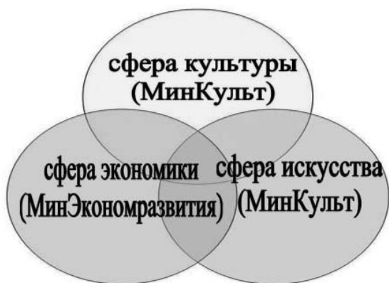
Рис. 2. Характер ведомственных компетенций

Для многих субъектов РФ данная модель может позволить наладить систему межведомственного взаимодействия, а также определить существующий потенциал каждой функциональной сферы – сферы культуры, сферы искусства и сферы экономики – для дальнейшего определения ресурсов в целях стратегического развития.