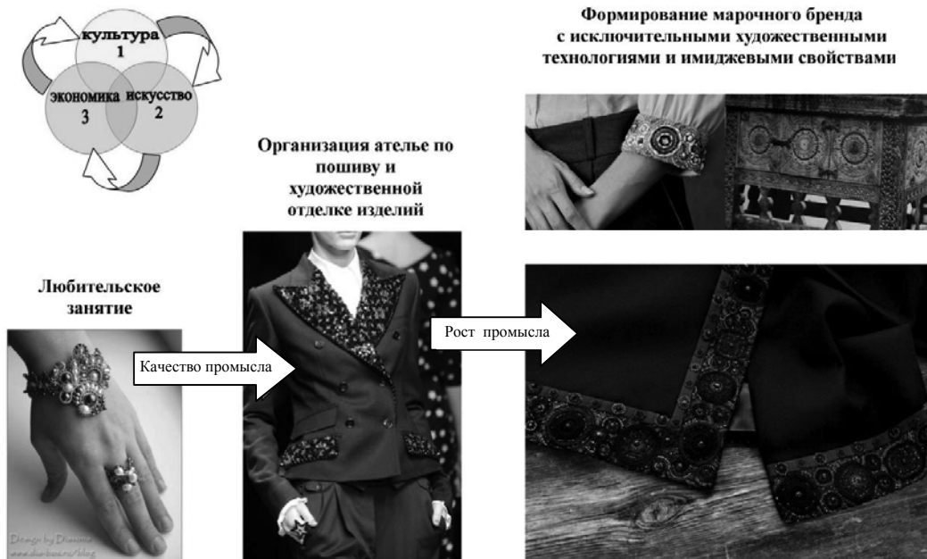
Рис. 6. Пример качественного роста промысла – вышивка бисером и изготовление изделий из бисера

дизайнерских услуг (LEVADNAJA DETAILS – марка, созданная в 2005 году с идеей преемственности русской культуры. Это российский бренд, который вплетает русские традиции в развитие моды) (рис. 6).