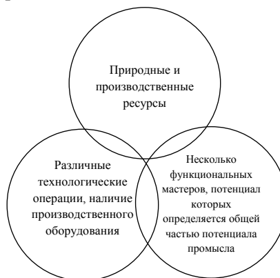
Рис. 3.2. Критерии структурно-функционального моделирования в классификации народно-художественных промыслов

Народно-художественный промысел – это вид промысла, который характеризуется двумя (или тремя), как основными, художественно-технологическими операциями, использованием природных и производственных ресурсов. Технология промысла является компетенциями основных мастеров, потенциал которых является частью общего потенциала промысла (терминология автора) (рис. 3.2). К ним относятся: строчевые промыслы, художественнаяковка, производство керамики, различные виды росписей и пр.