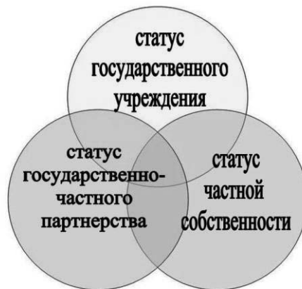
Рис. 9. Статус объекта НХП

2. Статус частной собственности. Законодательных мер для привлечения собственников