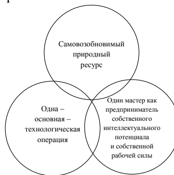
Рис. 3.1. Критерии структурно-функционального моделирования в классификации народно-ремесленных промыслов

Народно-ремесленные промыслы характерны для многих территорий – плетение из лозы, бересты, резьба по дереву, изготовление изделий из капа и пр.