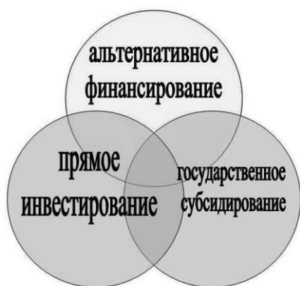
Рис. 10. Принцип комплексного финансового обеспечения объекта НХП и его территории

Альтернативное финансирование образовательных и социально-культурных учреждений существует как вид сформировавшегося государственного финансирования, непосредственно влияющего на комплексное развитие объекта НХП и его территории.